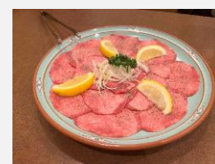
まずは上塩タン。1人前950円！1枚1枚が大きいですね。

ちなみに今回は焼肉を楽しみましたが、鉄板を囲む席もあり、鉄板焼きメニューも味わえるそうです。そちらも今度食べてみたいですね。それでは、次回の「くわ散歩」でまたお会いしましょう！