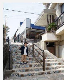
映えスポットと息子です