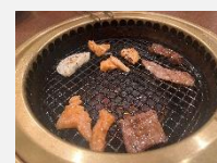
ちなみに、食べるのに夢中で焼いている写真がこの貧相な写真のみでした・・・